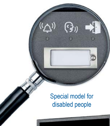
Special model for disabled people

2N ® Helios IP Force è progettato per funzionare nelle condizioni più impegnative. La robusta costruzione meccanica offre un'elevata copertura protettiva contro polvere e acqua (IP 69K) e protezione contro danni meccanici (atti vandalici). Le caratteristiche dei 2N ® Helios IP Force forniscono un elevato comfort agli utenti e garantiscono il controllo degli accessi per qualsiasi ambiente estremo.