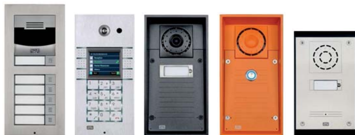
2N® Helios IP Verso